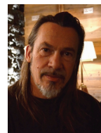
FLORENT PAGNY CHANTEUR