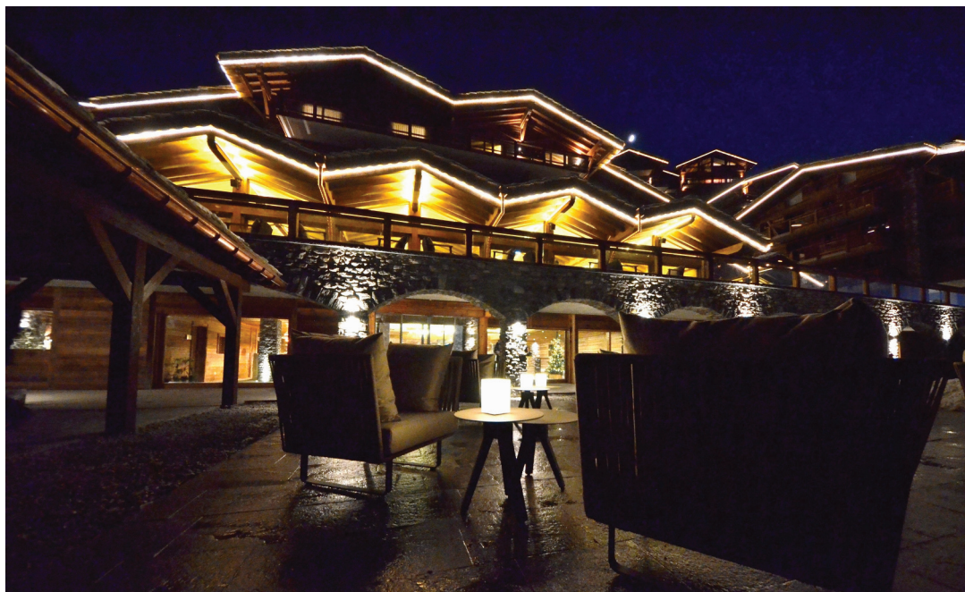
L'hôtel Nendaz 4 Vallées, situé dans le complexe Mer de Glace, offre 62 chambres et suites et devrait générer 20 000 nuitées par an.

Cette offre est-elle compatible avec une clientèle traditionnellement familiale? Sébastien