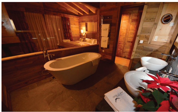
Certaines suites proposent une cheminée et une salle de bain ouverte sur la chambre, avec un sauna privatif. LE NOUVELLISTE

Epiney, directeur de Nendaz Tourisme, n'en doute pas. «La station a gagné en gamme, nous le voyons à tous les niveaux. En plus, le spa de l'hôtel constitue à lui seul un plus pour toute la station.»